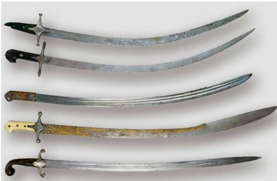
Рис.2.3. Козацька шабля з написом (реконструкція). Традиційна нагорода за бойові заслуги XVII–XVIII ст., символ особистої мужності та шляхетності.

Підсумовуючи середньовічний та козацький етапи, слід зазначити, що нагородна традиція еволюціонувала від натуральних форм (гривни, зброя, коні) до складних символічних конструкцій. Клейноди виконували функцію колективних нагород для всього війська, а індивідуальна зброя - для професійних воїнів. Цей період заклав ідейний підґрунтя: нагорода - це не лише прикраса, а публічне підтвердження честі та привілейованого статусу в суспільстві.