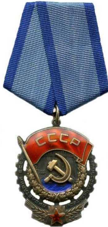
Рис. 2.10 Орден Трудового Червоного Прапора УСРР (зразок 1921 р.). Єдина державна нагорода радянської України до моменту централізації нагородної системи СРСР.

Однак період республіканської нагородної автономії був недовгим. За вказівкою центральної влади у 1933 році нагородження республіканськими орденами, у тому числі й українським, було припинено. Постанова Президії ЦВК СРСР від 23 квітня 1933 року передала всі повноваження щодо нагородження до компетенції загальносоюзних органів. Таким чином, орден Трудового Червоного Прапора УСРР став історичним раритетом, а його місце зайняв загальносоюзний варіант, заснований у 1928 році.