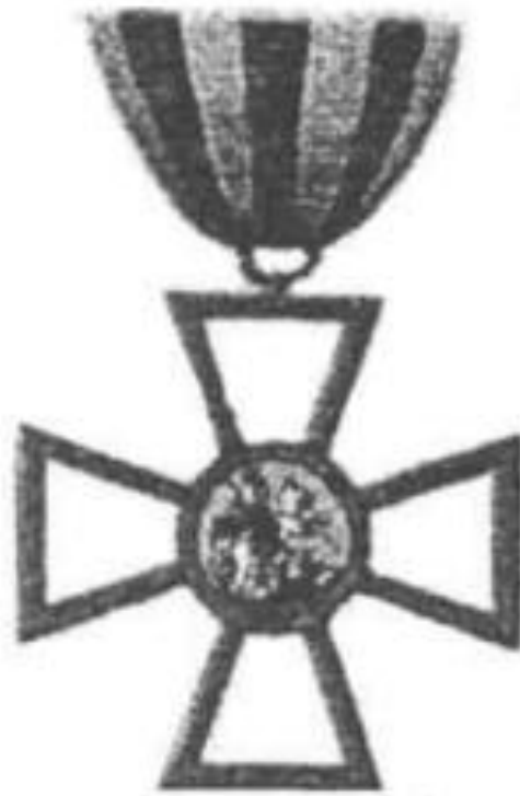
Рис.2.4. Георгіївський хрест 4-го ступеня. Найбільш шанована військова нагорода XIX ст. серед українців, символ особистої мужності на полі бою.

Окрім орденів, імперська Росія активно використовувала систему медалей за участь у конкретних військових кампаніях. Серед них: «В пам'ять Вітчизняної війни 1812 року», «За взяття Парижа 1814», «За захист Севастополя 1854-1855», «В пам'ять Російсько-турецької війни 1877-1878». Кожна така медаль була не лише відзнакою, а й джерелом певних пільг та поваги у громаді. Наприклад, медаль «За захист Севастополя» сьогодні оцінюється колекціонерами дуже високо, що відображає її історичну значущість [59].