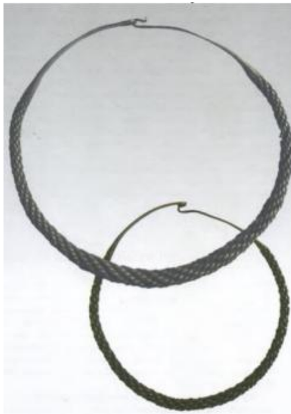
Рис.2.1. Шийна гривна Київської Русі (реконструкція). Типова нагорода дружинника XI–XII ст., що символізувала особисту хоробрість та вірність князю [5, с.27].

У Київському літописі під 1147 роком міститься чергова згадка про нагородну золоту гривну, що підтверджує сталість цієї традиції протягом століть. Шийні гривни як форма відзнаки проіснували до монголо-татарської навали та занепаду Русі, продовжуючи використовуватися в Галицько-Волинській державі як символ лицарської гідності. Сучасні реконструкції цих артефактів, знайдені на території Чернігівщини, демонструють високий рівень ювелірної майстерності давньоруських майстрів.