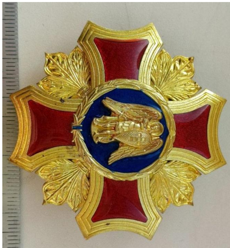
Рис.2.7. Проєкт ордену Святого Архистратига Михаїла (1918). Військова нагорода Гетьманату, що мала стати символом вищої воїнської доблесті.

Видатний художник Георгій Нарбут став автором багатьох ескізів державних знаків, банкнот та марок, що вплинуло на дизайн майбутніх нагород [40]. Нарбутівський стиль - поєднання козацького бароко з елементами модерну - став візитівкою української державності. Наприклад, у проєкті Державної Печатки Нарбут розмістив козака з мушкетом на синьому щиті, увінчаному тризубом, що символізувало тяглість від княжої доби через Гетьманщину до сучасності [25]. Ці ж мотиви планувалося втілити в орденських знаках [3].