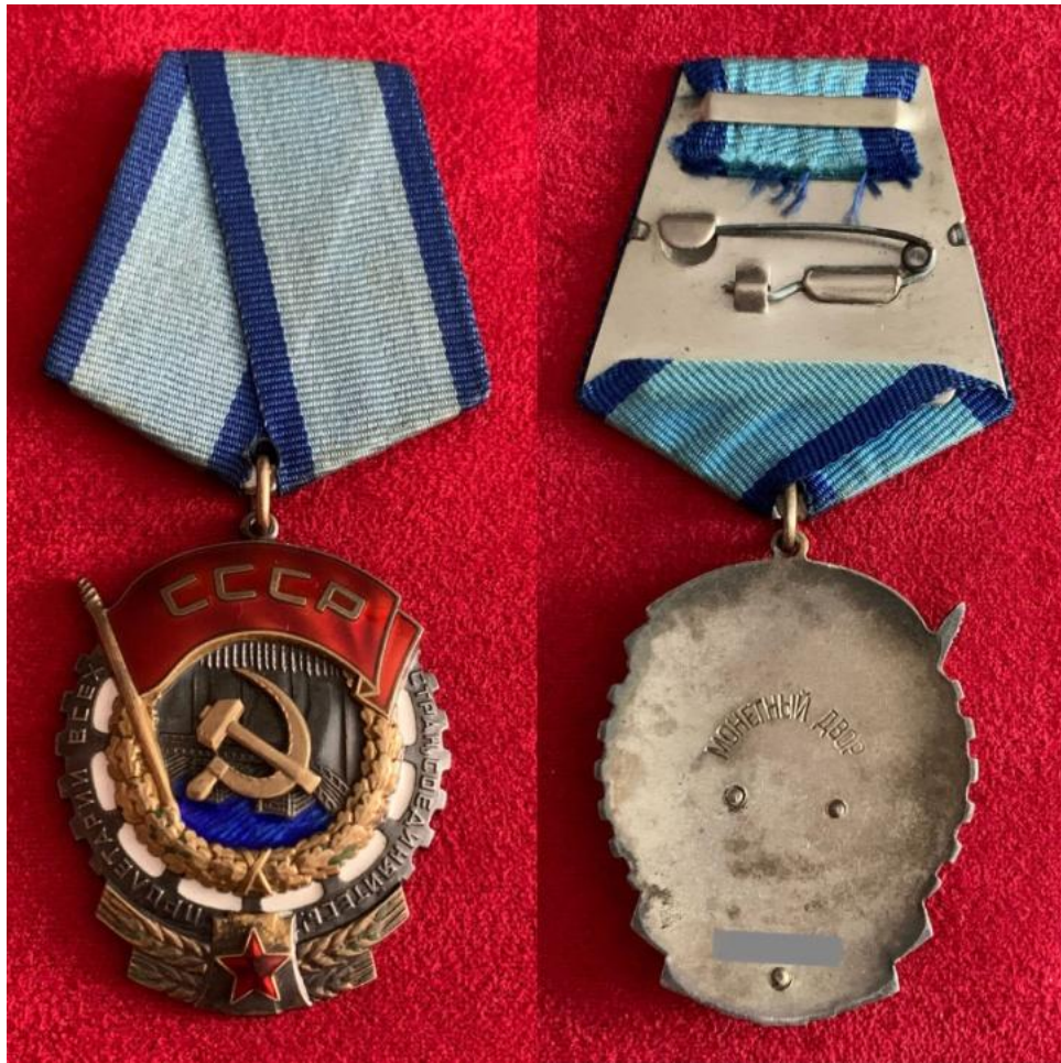
Рис. 2.11. Орден Трудового Червоного Прапора СРСР (тип 3, після 1943 р.). Уніфікована нагорода, що вручалася мешканцям УРСР протягом майже п'яти десятиліть.

Функціонування нагородної системи в УРСР після 1933 року було повністю інтегроване в загальносоюзний контекст. Нагороди стали частиною складного механізму соціального стимулювання, де кожен орден давав право на певні пільги - безкоштовний проїзд, надбавки до пенсії, першочергове отримання житла. В ієрархії радянських нагород орден Трудового Червоного Прапора стояв нижче ордена Вітчизняної війни, але вище ордена Дружби народів.