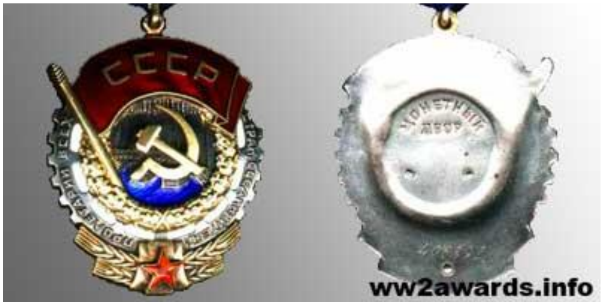
Рис. 2.12. Реверс ордена Трудового Червоного Прапора. Видно номер нагороди та клеймо монетного двору, що підкреслювало державний статус відзнаки [36].

власної, сучасної системи відзнак, що спирається на весь багатовіковий досвід нашого народу.