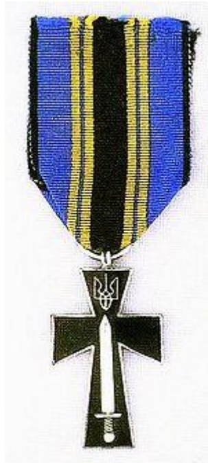
Рис.2.9 Хрест Симона Петлюри. Символ вірності ідеалам УНР, що вручався ветеранам визвольних змагань в еміграції.

Мистецтво Георгія Нарбута відіграло ключову роль у формуванні візуальної мови українських нагород. Його роботи над банкнотами у 100 та 500 гривень, марками «шагами» та державними печатками заклали канони використання тризуба та шрифтів. Нарбутівська «латинська N» та орнаментальні вінки з традиційних квітів стали впізнаваними елементами, які ми бачимо і на сучасних державних відзнаках [40]. Він показав, як через графіку можна висловити тяглість державності від Володимира Великого до сьогодення.