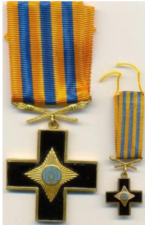
Рис.2.8 Залізний хрест УНР за Зимовий похід. Головна бойова реліквія Армії УНР, що вручалася за виняткову мужність у боротьбі з окупантами.