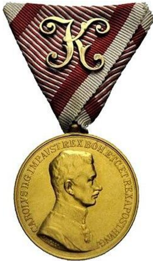
Рис.2.5. Австро-угорська медаль «За хоробрість» з профілем Франца-Йосифа I. Поширена нагорода серед галичан та буковинців у період Першої світової війни.

Цікавим аспектом імперського періоду було нагородження духовенства. Існували спеціальні церковні знаки та наперсні нагородні хрести на срібних ланцюгах, якими відзначали протоієреїв за багаторічну службу. Це свідчить про те, що нагородна система охоплювала всі сфери суспільного життя, інтегруючи церкву в державний апарат. Релігійні символи на нагородах (хрести, зображення святих) підсилювали сакральний статус державної влади.