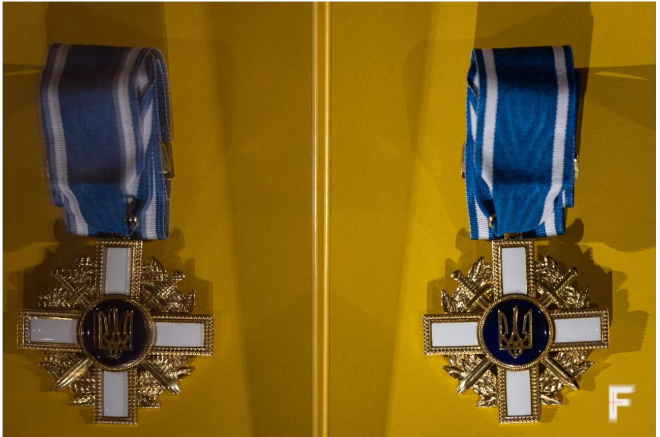
Рис.3.2 Орден «За мужність» I ступеня, Київ, Україна, 5 листопада 2025 року [17]

бою до систематичного прояву відваги протягом тривалого часу або стратегічного успіху цілої операції.