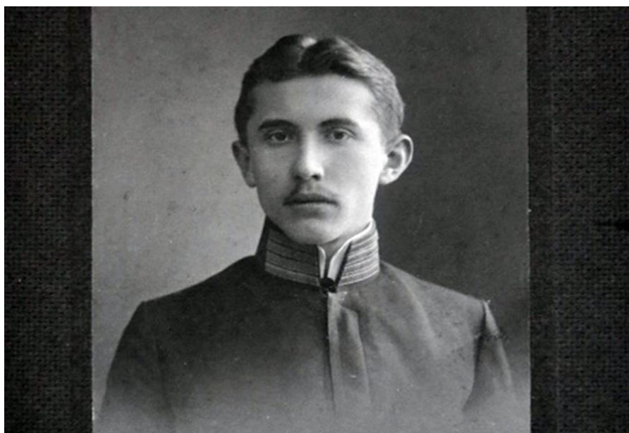
Фото травень 1909 р., на згадку про завершення гімназії у Львові.