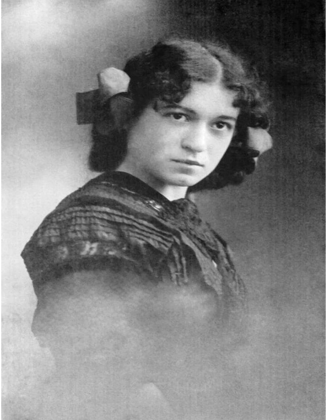
Рис. А. 1. Осипа Заклинська (1894–1972) [49]