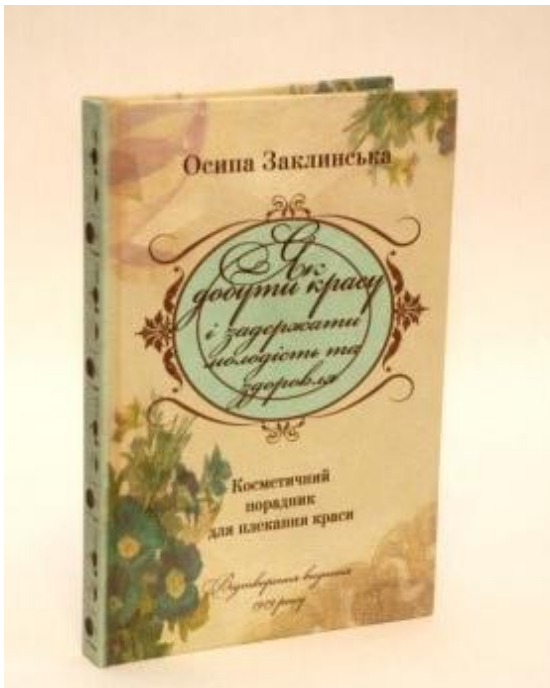
Рис. Б. 2. Титульний аркуш книги О. Заклинської «Як добути красу і задержати молодість та здоров'я». 2014 р. Режим доступу: https://boguslav.kyiv.ua/index.php/knigi-vidavnistva/9-krasa-zakl