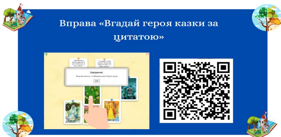
Рис. 1. Слайд з презентації до уроку з інтерактивними елементами.

Мультимедійна презентація може виступати засобом організації роботи на уроці і виконує організаційну функцію: допомагає давати чіткі інструкції щодо виконання вправ, організовувати ігрові моменти, поетапно пояснювати завдання. Вчитель демонструє слайди із завданням, тим самим структуруючи діяльність учнів. Наприклад: на слайді демонструється вправа до цієї ж казки, де чітко вказано що необхідно зробити, щоб виконати завдання (Рис. 2).